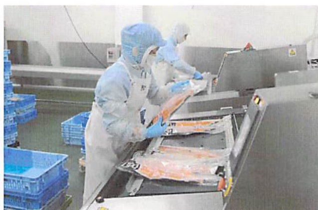
真空機に並べ、真空する