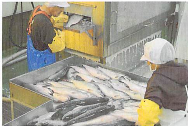
加工用機械に投入する