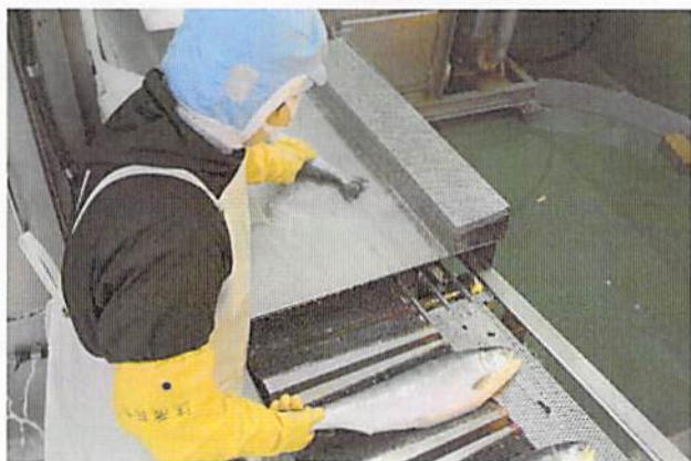
ヘッドカッター(加工機械)へ続く コンベアに魚を並べる