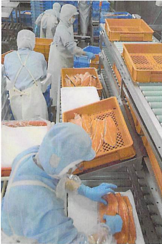
発泡スチロールへの箱詰め