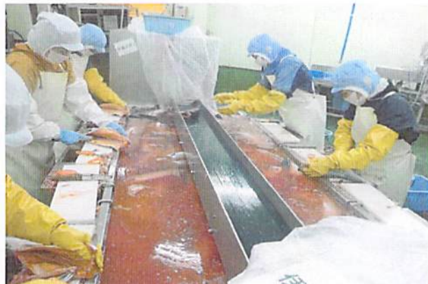
魚体洗浄の仕上げ