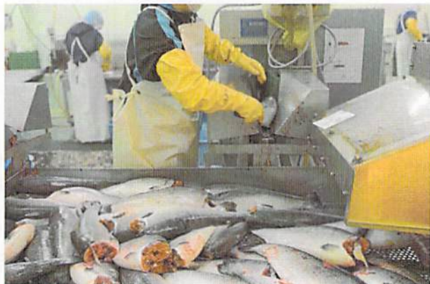
加工用機械に投入する