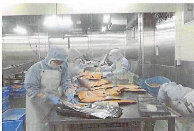
真空袋に魚を入れる(真空準備)