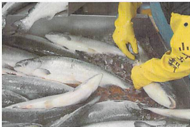
ヒレ切り機械を使ってヒレを切る